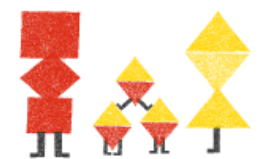
KAKSOS- JA KOLMOSPERHEET