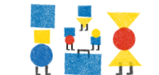
KAHDEN KULTTUURIN PERHEET