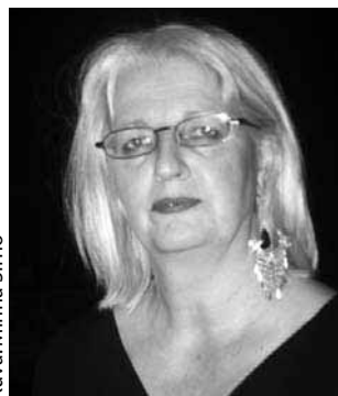
Kuva: Minna Sirmó